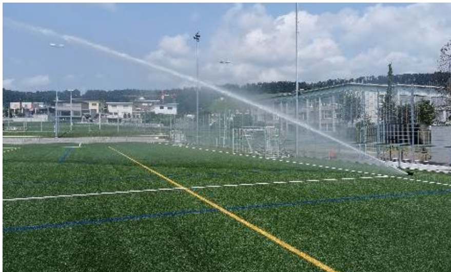
Abbildung 1: Beregnung eines Kunststoffrasenplatzes für Fussball im Sommer.

Im Rahmen eines Projekts wurden Sickerwässer und das Auswaschverhalten untersucht sowie ein Bewertungskonzept entwickelt. Sämtliche Ergebnisse sind in Berichten und einem Fachartikel veröffentlicht [1,2,3,].