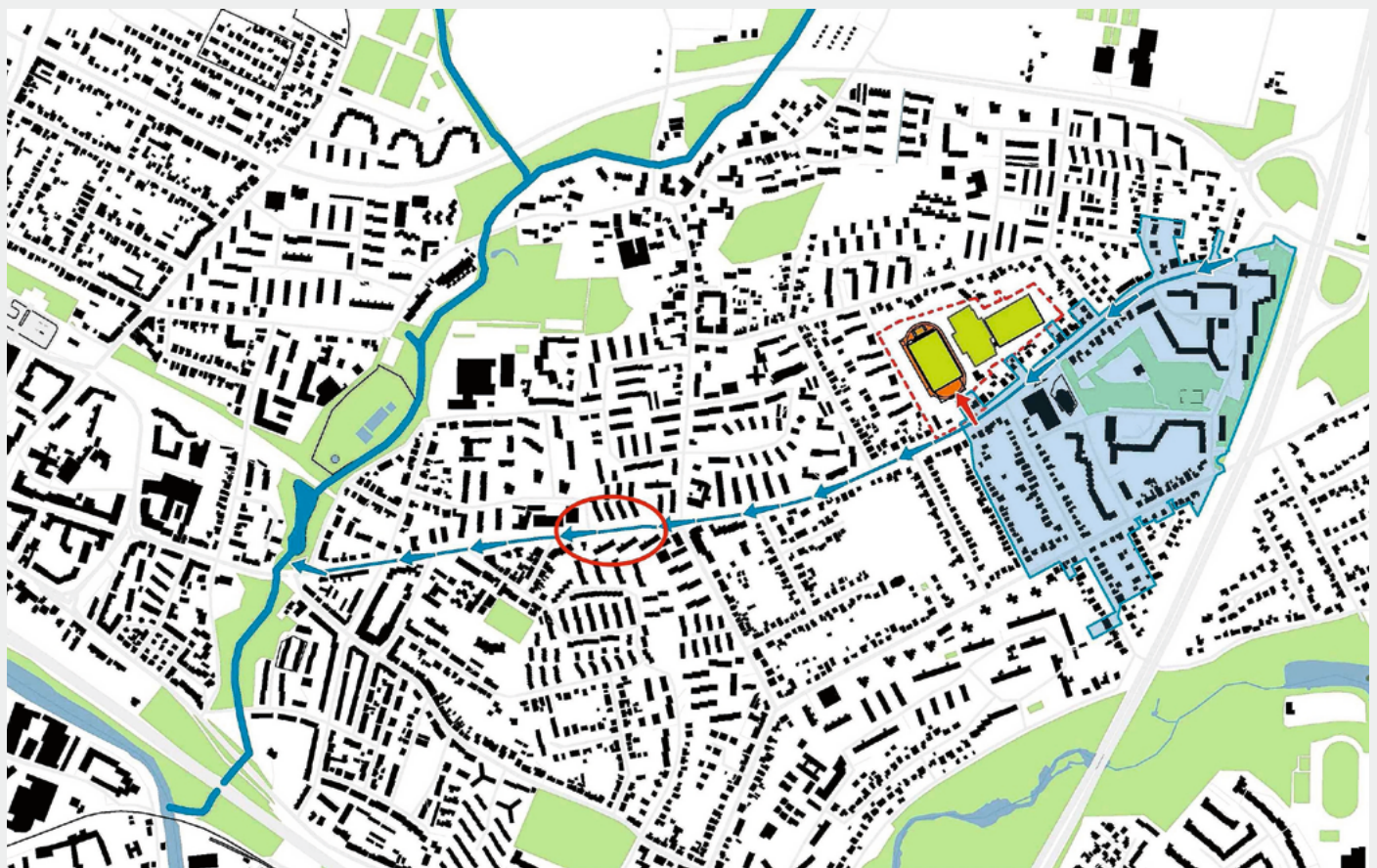
Fig. 1 Einzugsgebiet des überflutungsgefährdeten Bereichs. Blau umrandet das Einzugsgebiet der Notabflussleitung zur Sportanlage, rot umrandet der überflutungsgefährdete Strassenabschnitt.

Mit Hilfe von Versickerungsversuchen wurde der optimale Standort für die unterirdischen Anlagen ermittelt und wasserwirtschaftliche Massnahmen für die Starkregenvorsorge zusammen mit dem Umbau der Sportanlage Anfang 2019 ausgeschrieben. Frühzeitig wurden auch die zuständigen Stellen des Grundwasserschutzes eingebunden. Die Fertigstellung und Inbetriebnahme der multifunktionalen Sportanlage erfolgten im Jahr 2020. Finanziert wurde das Projekt durch die Hamburger Behörde für Umwelt, Klima, Energie und Agrarwirtschaft, das Bezirksamt Hamburg-Mitte und Hamburg Wasser.