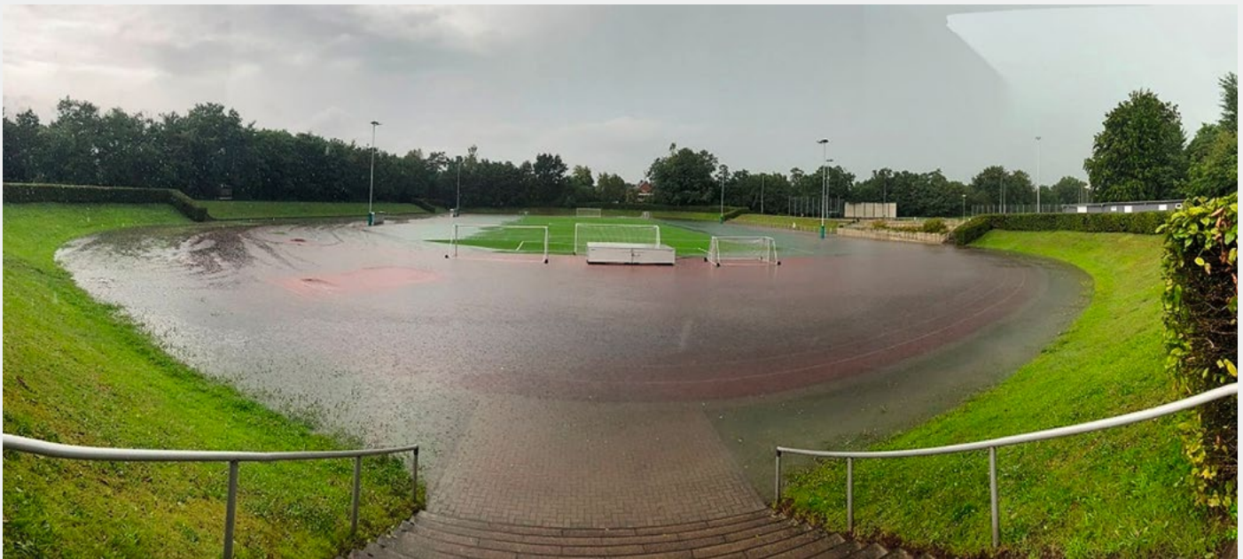
Fig. 5 Aufstau von Wasser auf der Oberfläche der Sportanlage bei dem Starkregenereignis vom 7. August 2024.