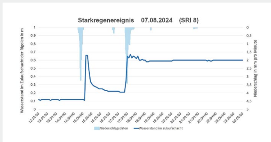
Fig. 3 Messergebnisse des Ultraschallmessgerätes während des Starkregenereignisses am 7. August 2024, Starkregenindex (SRI) 8.

Der Betrieb des Entlastungssystems unter der Sportanlage erfolgt derzeit durch eine jährliche Sichtkontrolle. Das Intervall der