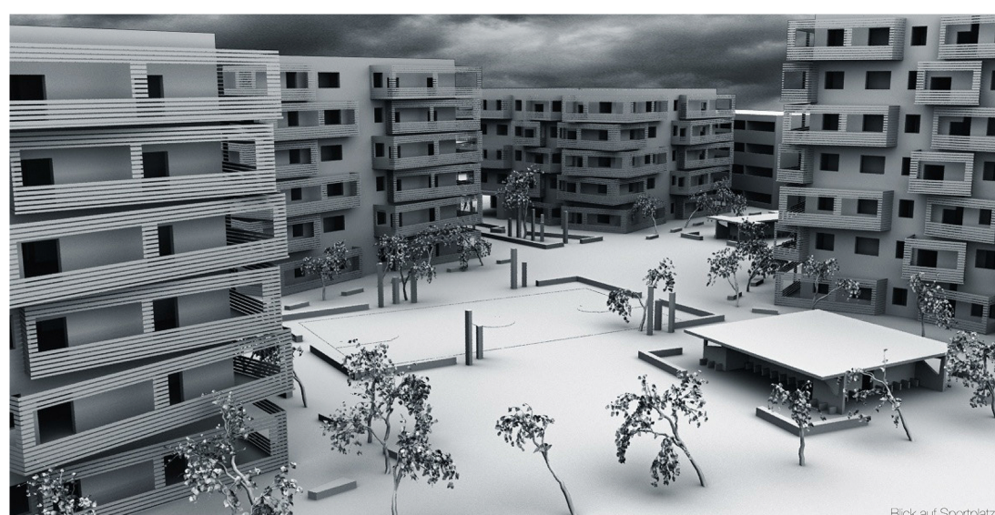
Blick auf Sportplatz