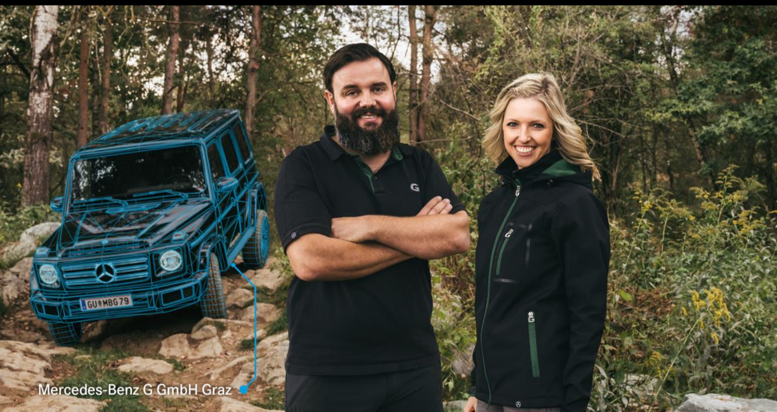
Mercedes-Benz G GmbH Graz