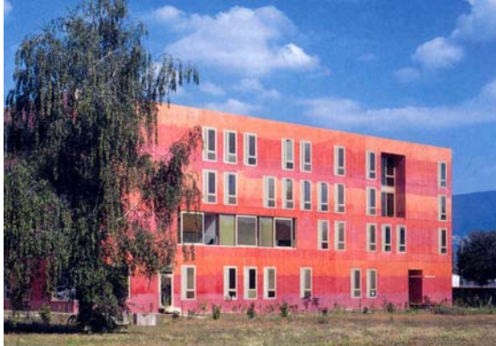
Bild 4: Devanthery & Lamunière Architectes, Psychiatrische Klinik, Yverdon-les Bains, 2003

Die Klassifikation von Sichtbeton für Architektur scheitert überall dort, wo sie Nutzung und Gestaltung in eine lineare Relation zu bringen versucht - etwa nach der Vorstellung, dass was besonders gestaltet oder repräsentativ ist, auch besonders glatt und präzise sein müsse.