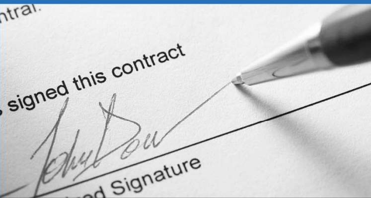
Eine unbefristete Festanstellung