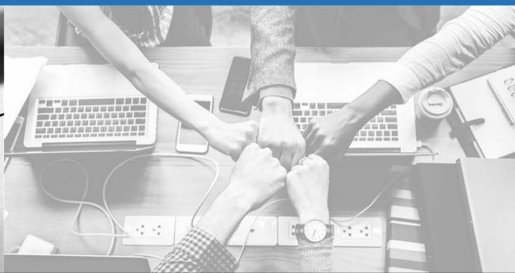
Eine wertschätzende Unternehmenskultur