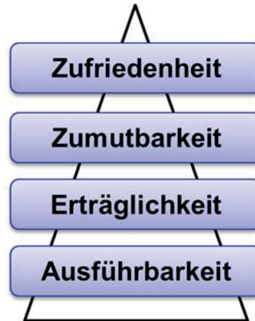
Abbildung 1: Beurteilungsebenen der menschlichen Arbeitsgestaltung

und damit die Konfiguration der Umgebungsfaktoren wie z.B. eines Radios im Kontext des Faktors „Dürfen“ dazu bei, dass die objektiven Merkmale der Arbeitssituation den individuellen Erwartungen der Arbeitsperson entsprechen und die Zufriedenheit zu steigern.