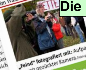
„Feind“ fotografiert mit: Aufpasser mit gezückter Kamera.

coli: „Das war ein Protest-Erholungsmarsch – und da im Wald nichts verloren.“