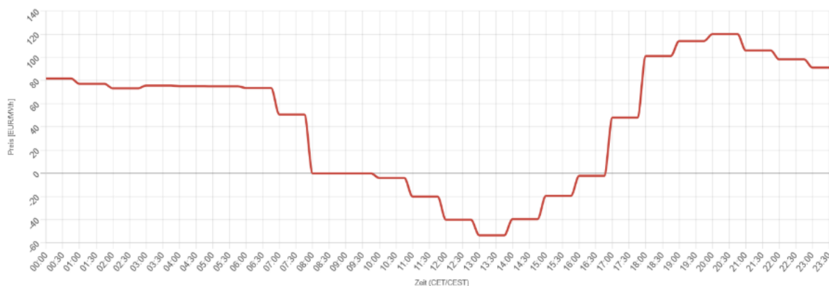
Abbildung 3: Verlauf des Strompreises am Beispiel 07.09.2025 [12]

Eine intelligente Ladesteuerungssoftware könnte etwa ermöglichen, das Fahrzeug unter Berücksichtigung eines vorab definierten Abfahrtszeitpunkts und einer gewünschten Mindestreichweite kostenoptimiert zu laden und es zwischenzeitlich als Speicher zu nutzen, um gegebenenfalls zusätzliche Erlöse aus der Rückspeisung zu erzielen.